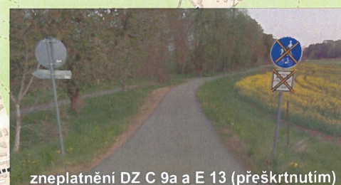
zneplatnění DZ C 9a a E 13 (přeškrtnutím)