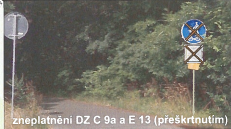
zneplatnění DZ C 9a a E 13 (přeškrtnutím)